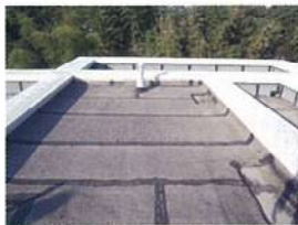
・陸屋根(露出アスファルト)