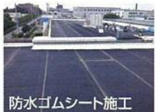
防水ゴムシート施工