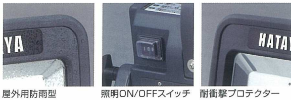
屋外用防雨型 照明ON/OFFスイッチ 耐衝撃プロテクター