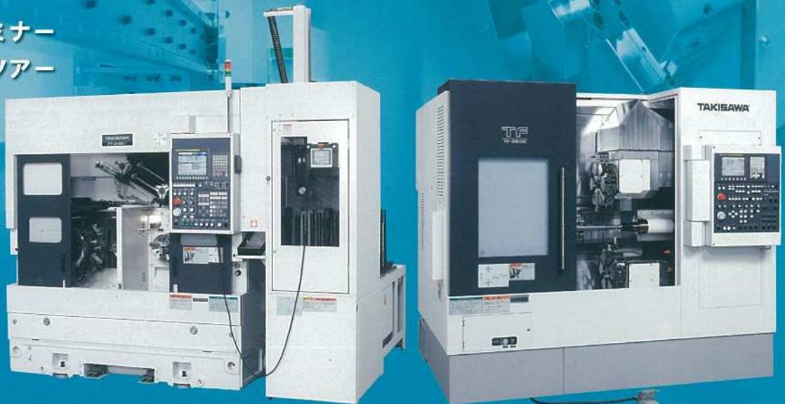
※写真は出展機の仕様とは異なります。