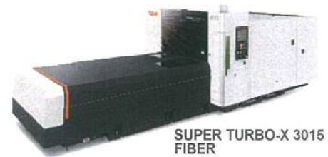
SUPER TURBO-X 3015 FIBER