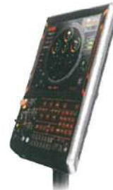
MAZATROL SMOOTH X タッチスクリーン操作の高速・ 高精度 5軸同時制御 CNC 装置