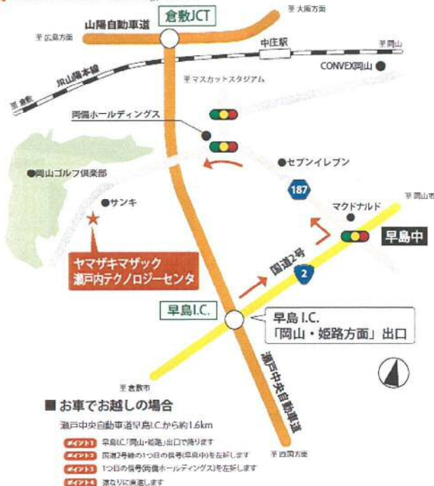
瀬戸内テクノロジーセンターへのアクセスマップ Access to Setouchi Technology Center

J R 山陽本線 中庄駅 (南口出口) タクシー約 8 分 瀬戸中央自動車道 早島インターチェンジより 8 分