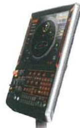
MAZATROL SMOOTH G タッチスクリーン操作の高速・ 高精度 4軸同時制御 CNC 装置