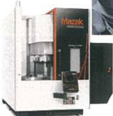
MEGA TURN 900M MAZATROL Smooth G 仕様 自動工具交換装置(オプション)仕様